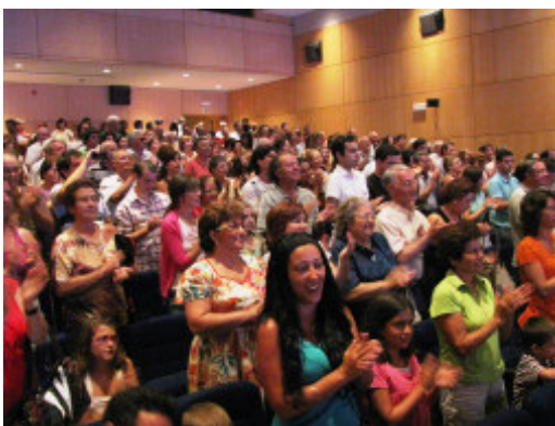
Fotos de Célia Domingues: A cena das Janeiras (em baixo à esq.); O Grupo e o Público no final do espectáculo (em cima).

Conhecemos todos os intervenientes: são proencenses, ou cá residem, têm entre os 8 e os 80 anos e são totalmente amadores, mas provaram, todos eles, que têm alma de artista e que com vontade e querer, e com algum trabalho, tudo se consegue.