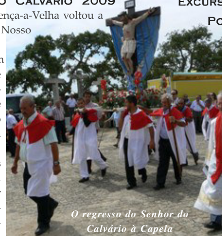
O regresso do Senhor do Calvário à Capela

Este ano a novidade e também o ponto forte da excursão vai ser a descida do rio Douro de barco, desde a Régua até Gaia. De Gaia seguir-se-á então de autocarro até à Quinta do Santoinho.