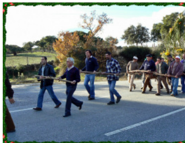
Transporte do Madeiro - 8 Dez 2008

Para os proencenses o dia 8 de Dezembro, dia-santo-de-guarda, é duplamente celebrado. Para além de comemorarmos o dia da Imaculada Conceição, padroeira de Portugal e padroeira da nossa Misericórdia, temos o Madeiro. Festa dos rapazes, mas à qual, desde sempre, toda a população se associa.