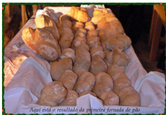
Aqui está o resultado da primeira fornada de pão

Esperamos agora que haja capacidade para saber aproveitar e potenciar esta nova estrutura ao serviço da população e de Proença-a-Velha.