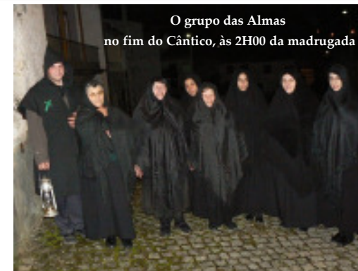
O grupo das Almas no fim do Cântico, às 2H00 da madrugada

Para os que residem fora não se esqueçam de marcar na agenda esta data e aparecerem, para ajudarem a tornar este dia numa grande festa de proencenses.