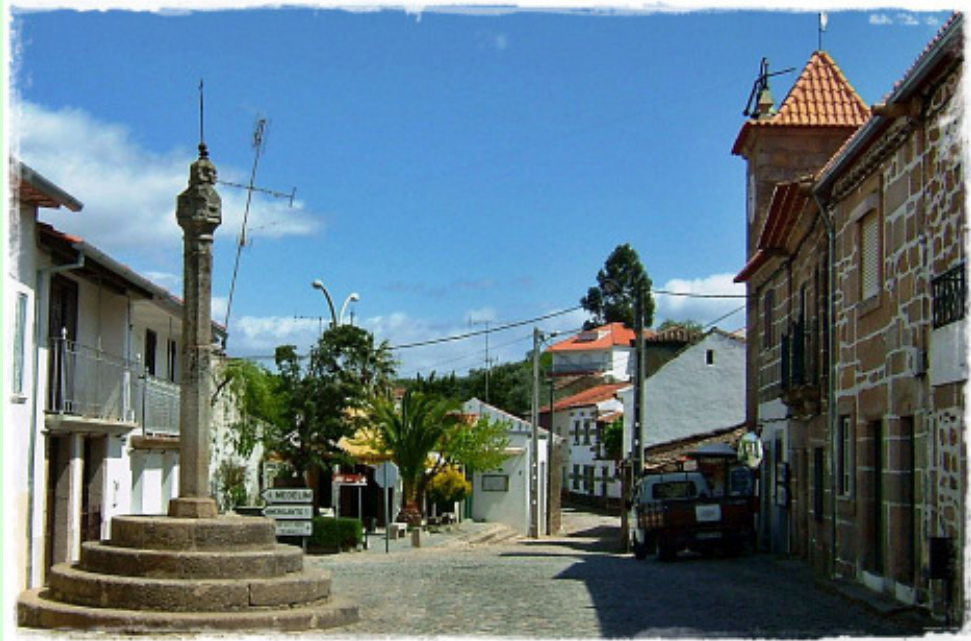
Proença-a-Velha - Largo da Praça

PROENÇA-A-VELHA, 1218, 1510, 1836, 20?? - ETAPAS DE UMA POVOAÇÃO.