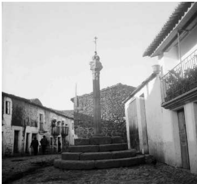
Foto Enigma! A Resposta! Tal como havíamos prometido no último número, aqui estamos a tirar as dúvidas, se é que as houve, sobre o local da foto então publicada. Apresentamos hoje a foto original (anos 40 ou 50 do séc.XX) e uma de 2008. Quem quiser que atente nas diferenças! Até uma esquina ficou mais redondinha!... A maior das diferenças? Leiam o poema do JAC e tirem as vossas conclusões!...

Distribuição gratuita a todos os associados.