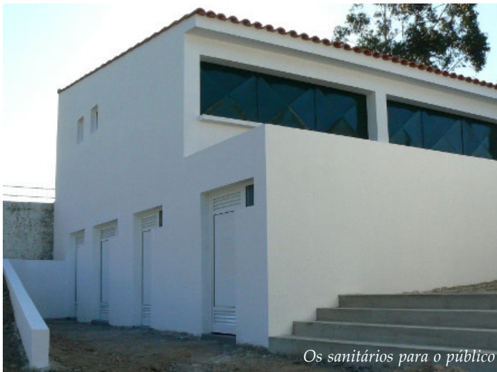
Os sanitários para o público

Entretanto a Junta de Freguesia chegou a acordo com o proprietário do terreno situado do lado direito do caminho de acesso ao recinto do Senhor do Calvário, cujo muro se encontrava muito degradado e está a proceder ao seu arranjo e simultaneamente ao alargamento do respectivo caminho, facilitando a circulação.