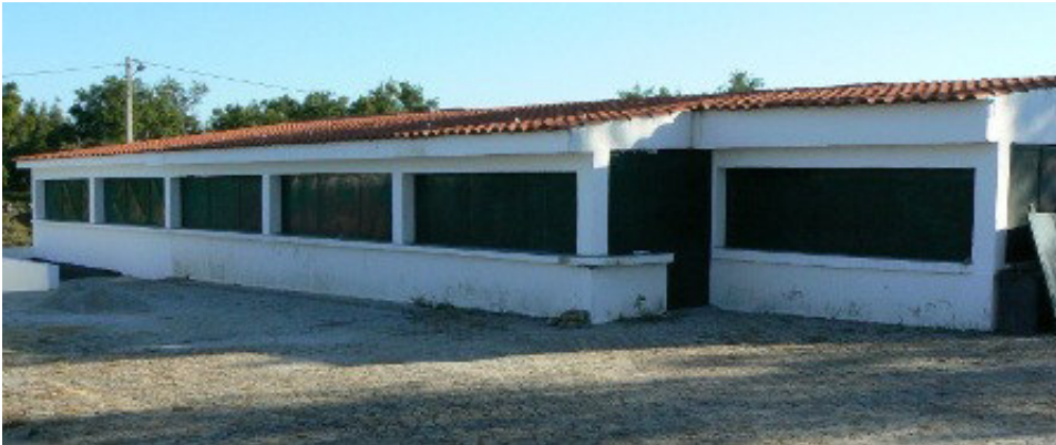
O novo edifício de apoio ao Restaurante e Bar